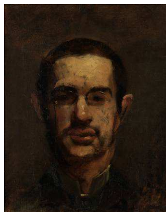
Portrait de Toulouse Lautrec, tête nue, de face , 1883