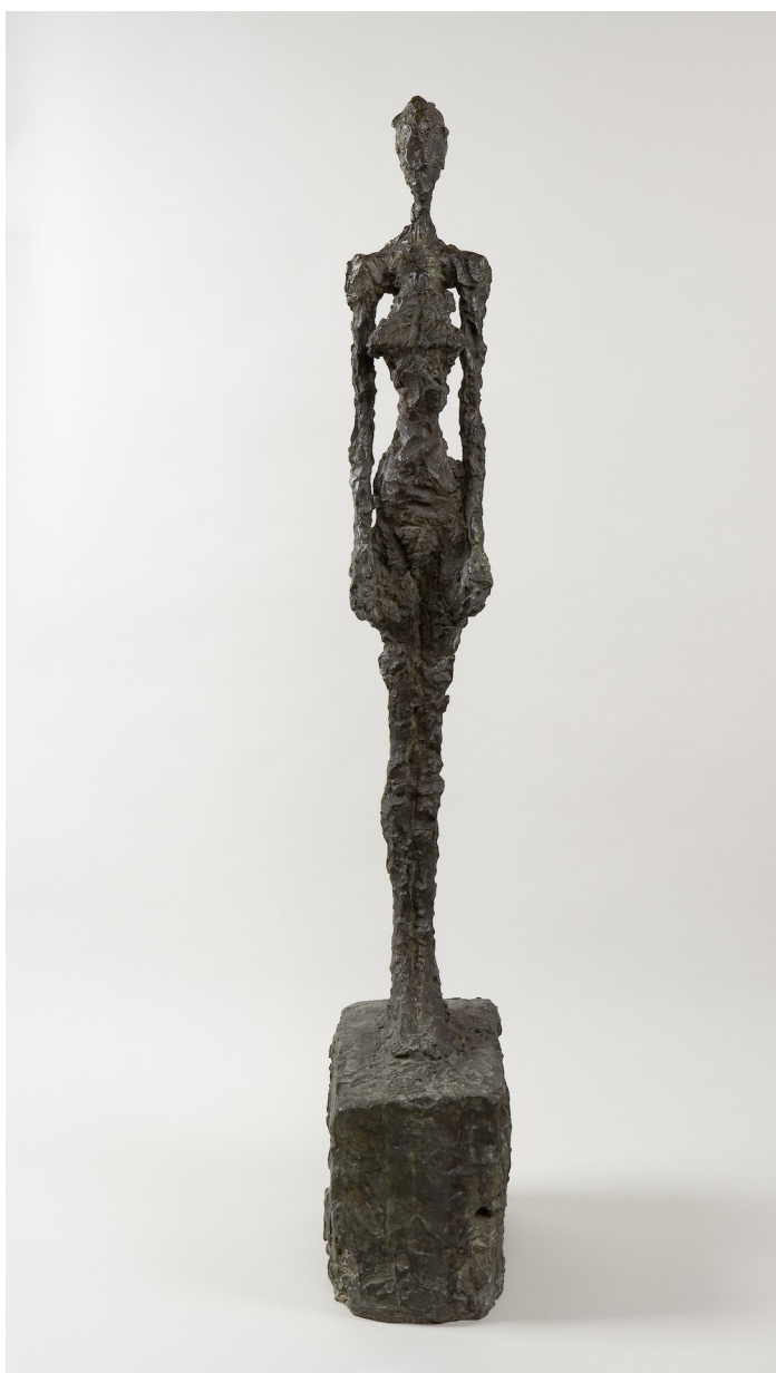
Femme debout 1957 Bronze 131,5 x 19 x 32,5 cm Collection de la Fondation Giacometti, Paris © Succession Alberto Giacometti (Fondation Giacometti Paris + ADAGP Paris) 2019