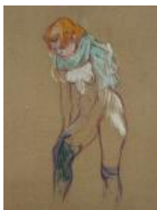
Femme qui tire son bas , HTL (1894) Musée Toulouse-Lautrec-Albi, France