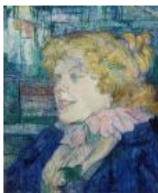
L'Anglaise du Star au Havre , HTL (1899) Musée Toulouse-Lautrec-Albi, France