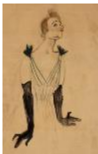
Yvette Guilbert , HTL (1894) Musée Toulouse-Lautrec-Albi, France